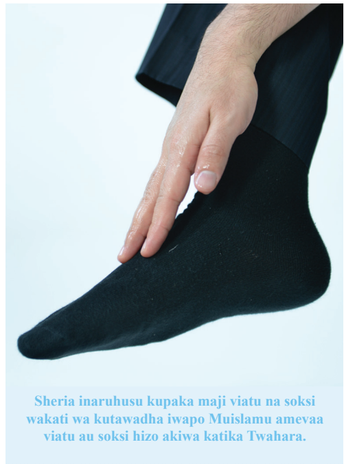
Sheria inaruhusu kupaka maji viatu na soksi wakati wa kutawadha iwapo Muislamu amevaa viatu au soksi hizo akiwa katika Twahara.