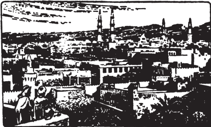
Mji wa Madina

Alfajiri ya pili, Makureshi walistaajabu kumwona Ali Akitoka kitandani. Kutafutwa kwa hadhari kulifanywa kila mahali na zawadi kubwa zilitolewa. Baadhi ya watafutaji walifuata alama za miguu ya Mtume (S.A.W) na Abu Bakar, na wakafika mpaka katika mahali pa kuingia pangoni. Abu Bakar (furaha ya Mungu iwe juu yake), kusikia sauti ya miguu yao, alihuzunika sana, si kwa ajili yake, bali kwa yule ambaye maisha yake, kwake, yalikuwa ghali zaidi kuliko yake mwenyewe. Ulikuwa ni wakati wa kuhangaisha sana. Kama maadui wangetazama tu ndani ya pango hilo, Mtume (S.A.W) na Abu Bakar wangepatwa katwa vipande. Lakini kuamini kwao katika nguvu ya mikono yenye nguvu ya ulinzi wa Mungu kuliwaokoa. Hata katika muda huu ambapo mambo yalikuwa mabaya sana. Moyo wa Mtume (S.A.W) ulikuwa katika utulivu kabisa wala haukuwa na woga.